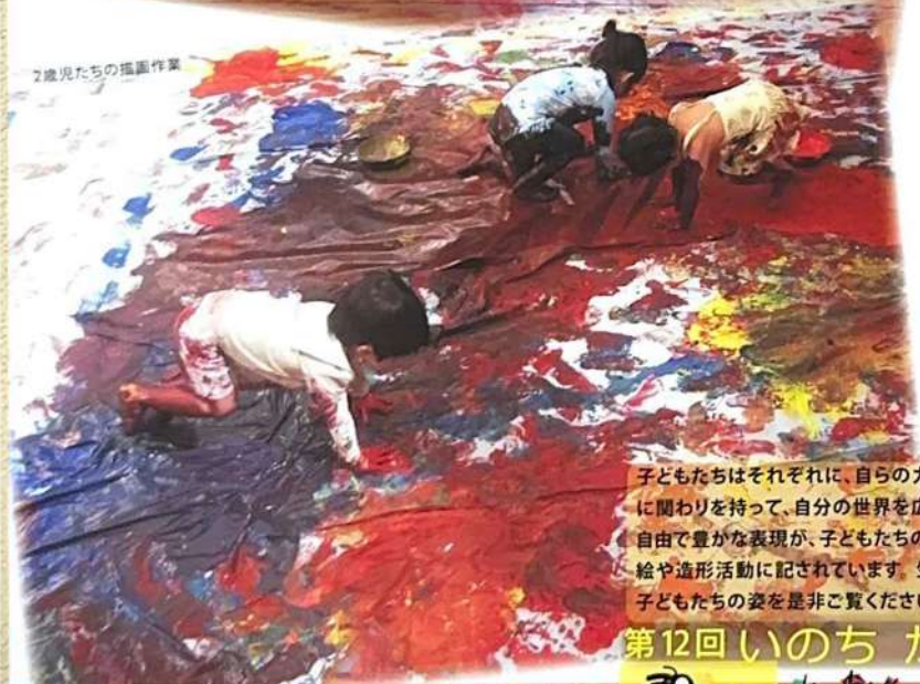
2歳児たちの描画作業