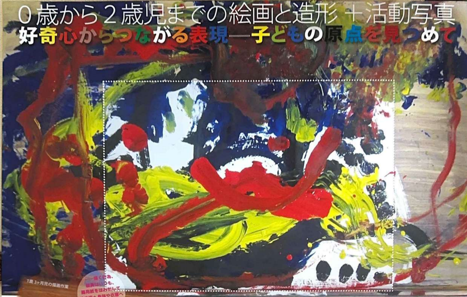
1歳3ヶ月児の描画作業

「早く描き、 描画はいつも、 画用紙をはみだして、 机や床へ身体や衣服へ どんどん広がって いきます！」