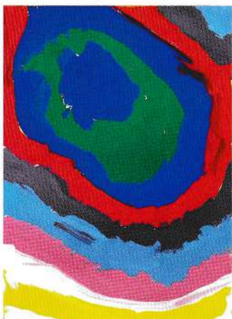
小田 珠愛（6歳4ヶ月） / 稲光園