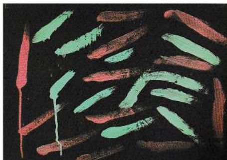
福井 絃葉（6歳6ヶ月） / 大野保育園