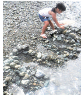
みそみ保育所 5歳児