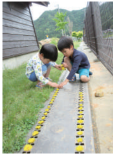
とぼっ子保育園 2歳児