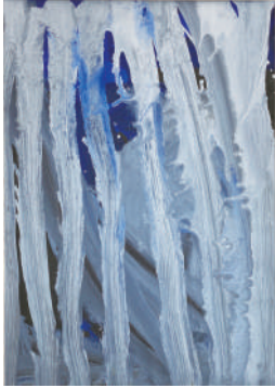
島田すず 3歳4ヵ月 光輪保育園