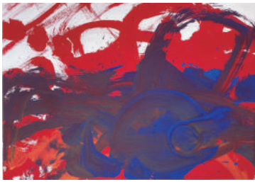
茅野稜真 1歳10ヵ月 ベつぷ里山こども園